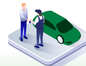
↑ Bilen lämnas till kunden