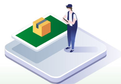
↑ Beställning av reservdelar för service