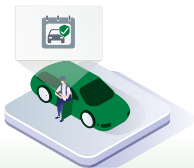
↑ Kundhantering - bilen registreras