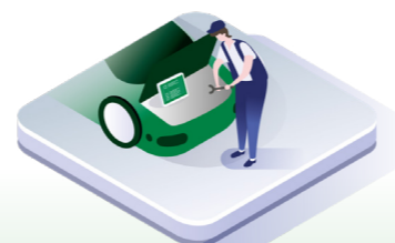
↑ Service utförs och införs i macsDIA