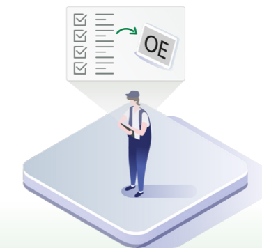
↑ Tjänsten överförs automatiskt till biltillverkarens serviceportal